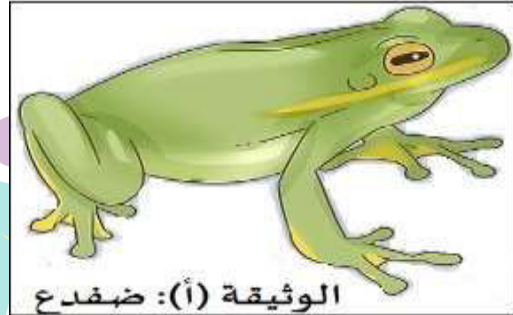
الوثيقة (أ): ضفدع